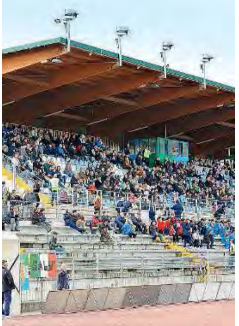
In casa. La Feralpi può contare oggi sui tifosi del Turina