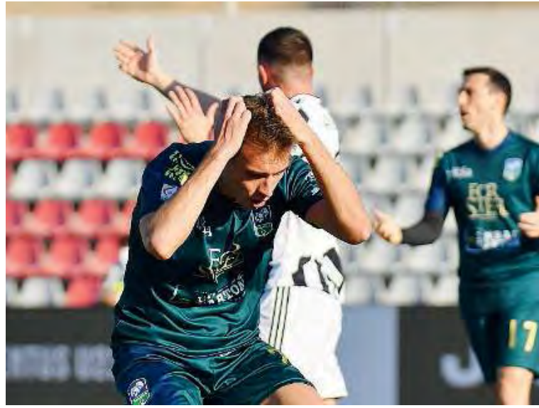
Herghelighiu. Mani nei capelli per il giovane salodiano dopo l'occasione fallita