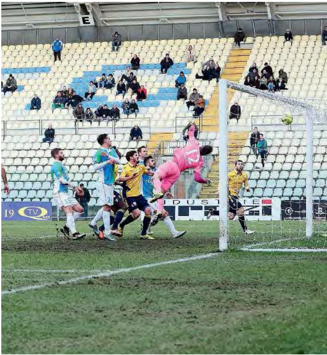
Punizione a giro. Popescu manda palla all'incrocio dei pali, è 1-0 Modena