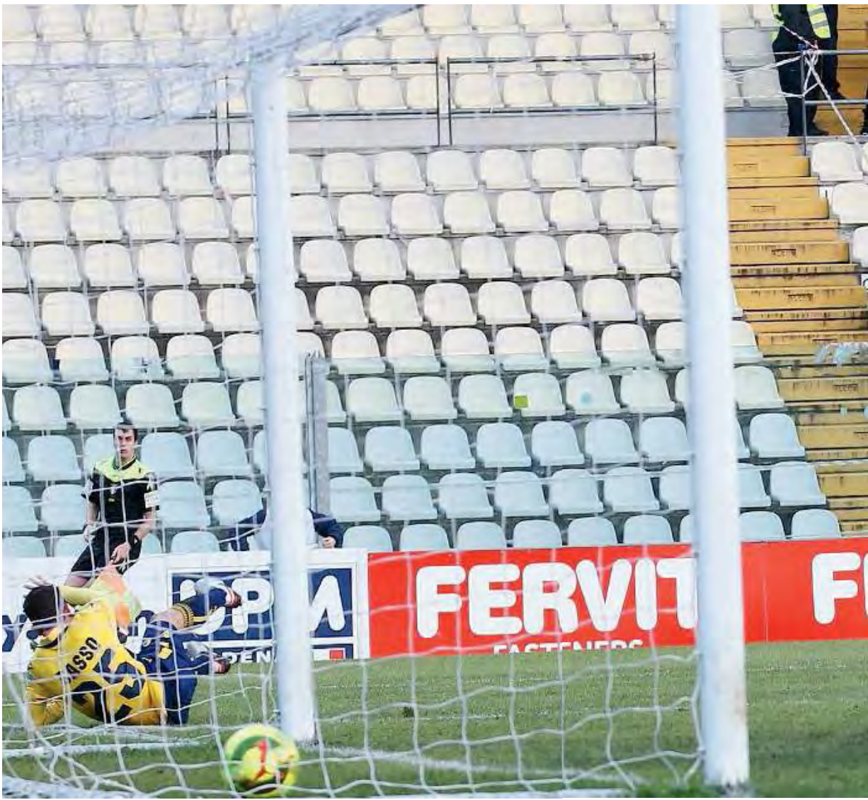
Morale Basso. L'esterno dei canarini ha appena segnato il gol del 2-1