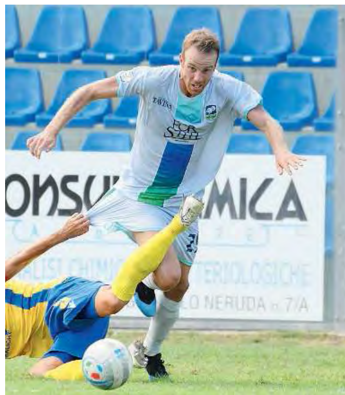
Titolare. Stanco pare in vantaggio su Caracciolo per giocare dal via

Allenatore: Bertoni Panchina: 1 Liverani, 2 Eleuteri, 3 Mordini, 5 Rinaldi, 14 Altare, 21 Carraro, 27 Guidetti, 9 Caracciolo, 19 Bertoli, 20 Mauri