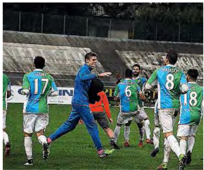
Festa grande. La FeralpiSalò espugna il campo del Bassano

di mezz'ala destra e lo ricopre da manuale, combattivo e intraprendente. Una spina nel fianco del Bassano.