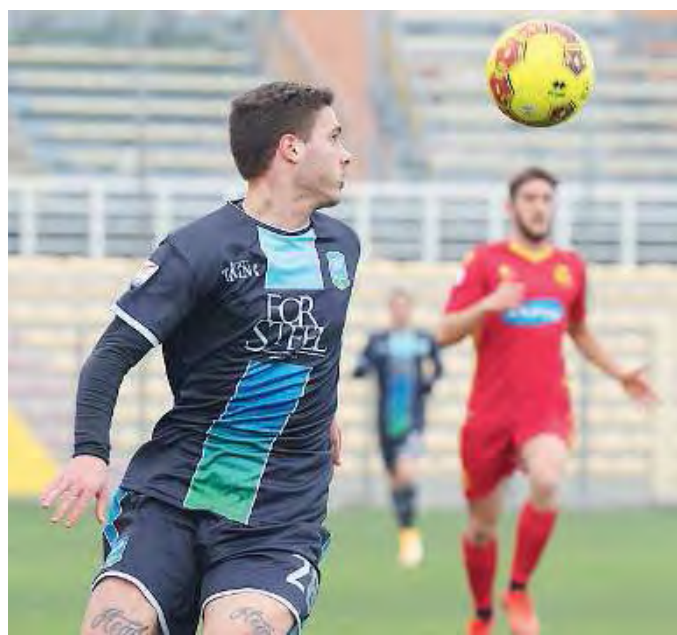
Farabegoli. Il giovane difensore è diventato un punto fermo per Pavanel

Pavanel ben conosce le abilità tattiche del tecnico ospite Bagatti, del quale anche alla vigilia del match d'andata ha decantato le lodi, quindi non svela nulla sul probabile undici di questo pomeriggio. Le certezze, però, non mancano, a parti-