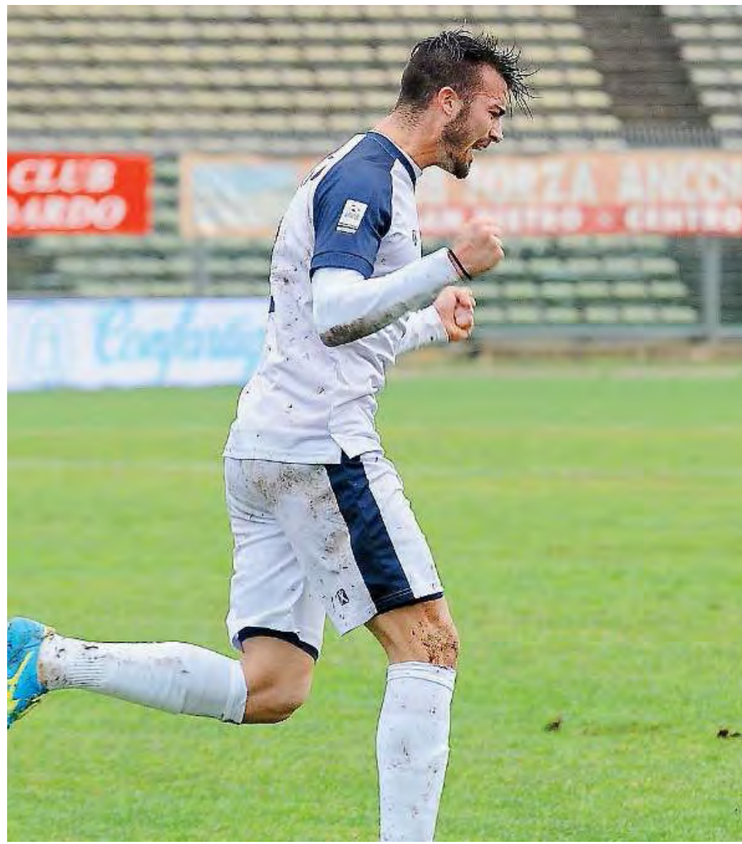
Attacco. Il Lumezzane deve segnare più spesso per allontanarsi dalla zona a rischio