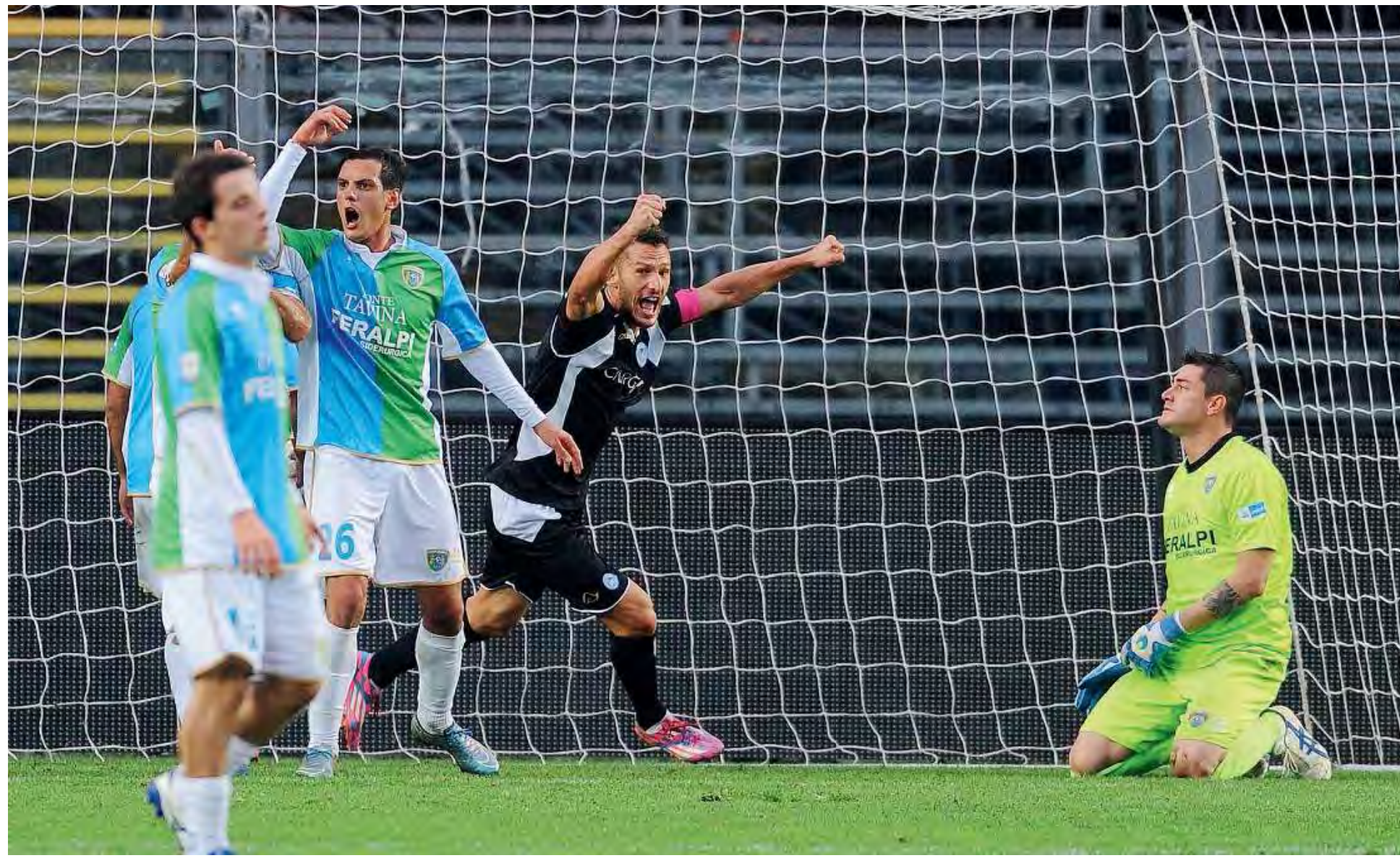
Difesa. La FeralpiSalò deve ridurre i gol incassati per risalire la classifica