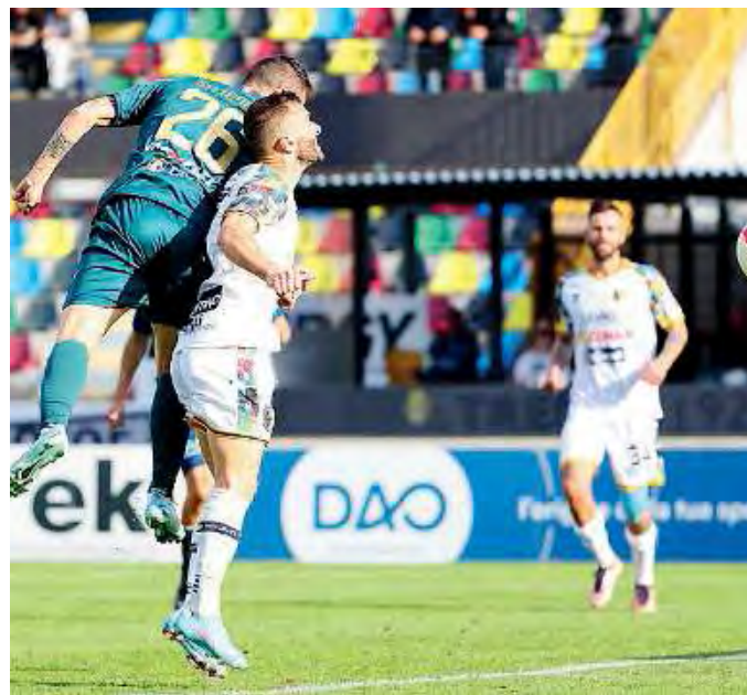
L'ultima occasione. Siligardi di testa sfiora il palo

Il pari allunga la serie utile e la Feralpi resta capolista: ma ora bisogna attendere la risposta delle rivali. //