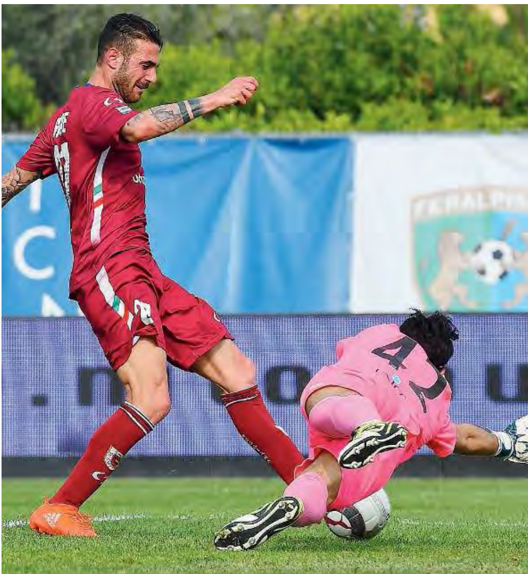
Il regalo. Vaccarecci non trattiene, Guidone punisce

4,5 Perilli; 5 Spanò (43' st Sabotic sv), 6,5 Trevisan, 6,5 Rozzio, 6 Contessa; 6 Ghiringhelli, 6 Bovo (34' st Calvano 5,5), 5,5 Genevier, 4,5 Carlini; 7 Cesarini, 7,5 Guidone