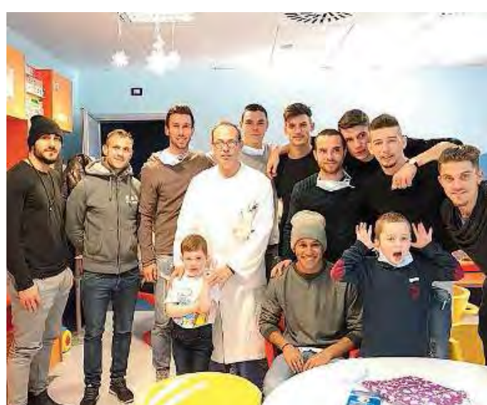
Lumezza in ospedale. Una delegazione di giocatori rossoblù ha fatto visita al reparto di oncologia pediatrica del Civile

popolare in tribuna, con gente che si alza e si butta a cavalcioni della balaustra che delimita il campo (sintetico pessimo...). Le minacce durano una buona ventina di minuti. La seconda: nel dopo-partita ci capita di assistere (in una crio-sala stampa non riscaldata) a un'intervista formato interrogatorio da parte di uno storico giornalista locale all'allenatore Lamberto Zauli. Il primo, di fatto, spiega al secondo, giocatore per giocatore, come dovrebbe giocare il Teramo. Altro che ct, siamo tutti allenatori di LegaPro!