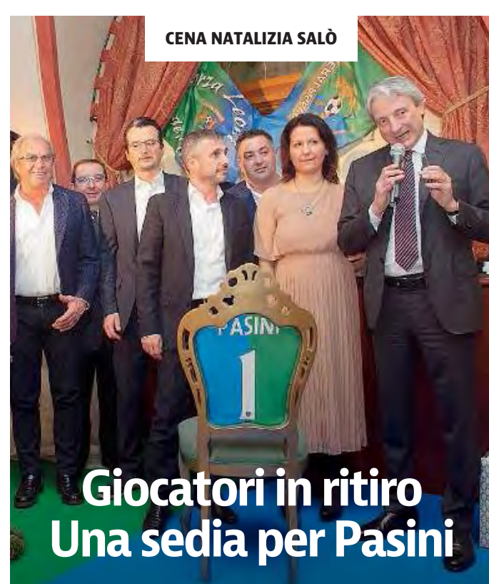
CENA NATALIZIA SALÒ

La classifica. Inter 29; Como 27; Cremonese 25; Torino 23; FeralpiSalò 22; Giana 16; Renate 15; AlbinoLeffe, Lumezzane, Piacenza e Alessandria 13; Parma 12; Pro Piacenza e Südtirol 11. // E. PASS.