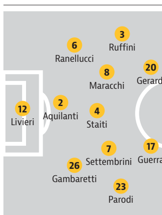
Stadio Lino Turina di Salò - Ore 18.30 - Arbitro: Annaloro di Collegno Diretta Tv: Sportube.tv

Allenatore: Asta Panchina: 1 Cagliioni, 13 Allievi, 19 Codromaz, 15 Turano, 5 Davi, 14 Gamarra, 16 Boldini, 24 Murati, 9 Romero, 11 Bizzotto, 18 Luche