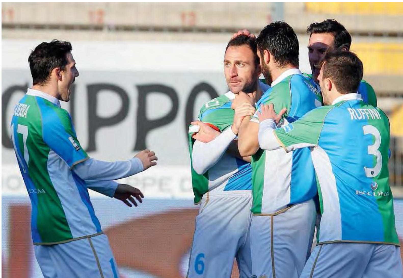
Riscatto. La FeralpiSalò alla ricerca della vittoria perduta

* Classifica in Serie B - Dalla 2 a alla 10 a ai play off. Dalla 10 a alla 19 a ai play out - 20 a in Serie D