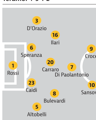
Stadio Bonolis - Ore 14.30 - Arbitro: De Angeli di Abbiategrasso Diretta tv streaming www.sportube.tv

Allenatore: Zauli Panchina: 22 Calore, 2 Capitano, 13 Manganelli, 15 Karikalis, 28 Sales, 4 Peterman, 24 Martini, 25 Cesarini, 27 Steffè, 11 Petrella, 18 Forte, 21 Fratangelo