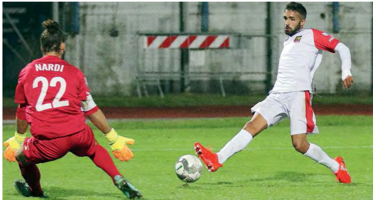
Russini. L'esterno del Lumezzane quasi certamente titolare contro il Forlì