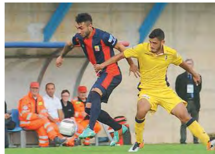
Speciale. Prima da titolare per la punta rossoblù, qui contro il Modena