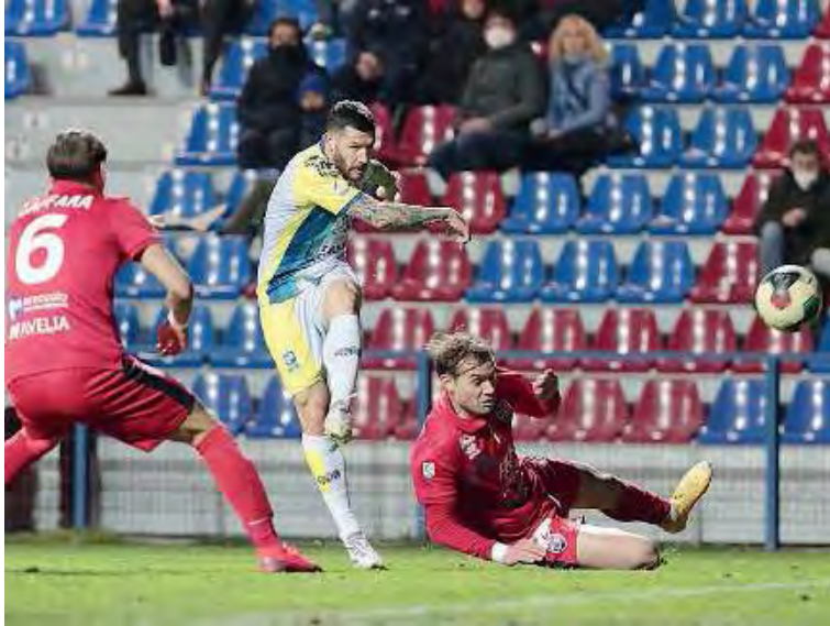
Assedio. Di Molfetta da dentro l'area sfiora il sette della porta scaligera