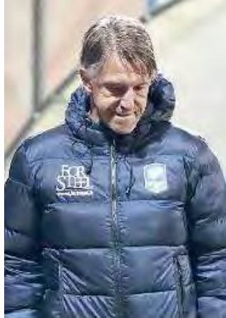
Vecchi. La delusione a fine gara

«L'abbiamo affrontata nella maniera giusta. Dobbiamo solo fare un esame di coscienza, perché ancora una volta abbia-