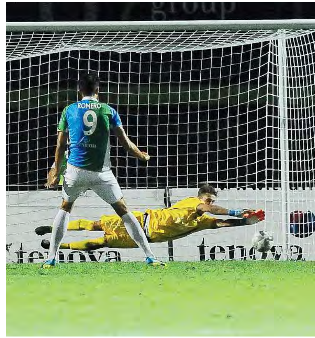
Attaccante impietrito. Volpe para il rigore a Romero al novantesimo

7.5 Volpe; 6 Marini, 6.5 Burzigotti, 6 Rinaldi, 6 Zanchi; 7 Valagussa, 6.5 Romano, 6.5 Giacomarro (35' st Croce 6 ); 6.5 Casiraghi (25' st Conti 6 ), 6.5 Candellone (41' st Musto sv ), 7 Ferretti.