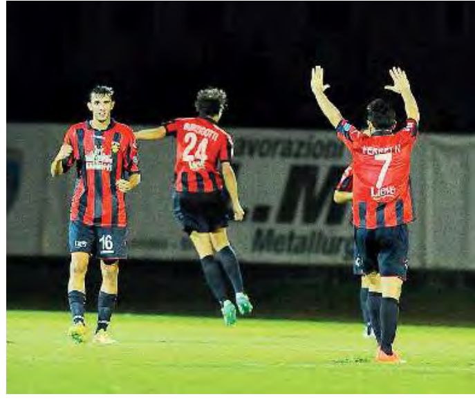
La gioia dopo la rete. I giocatori del Gubbio festeggiano il gol