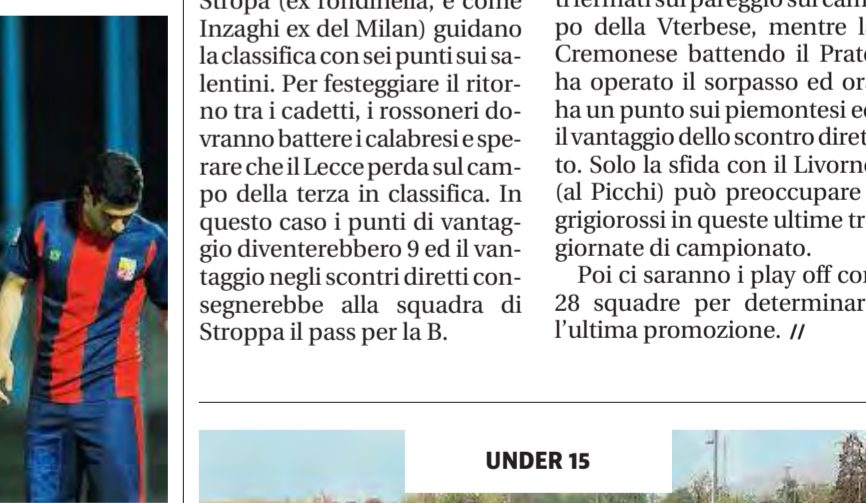
Rossoblu. Necessaria la reazione dopo il ko contro il Südtirol

Ma il tempo stringe e non ci si può voltare indietro, bisogna pensare solo alla partita con l'AlbinoLefte: «Io mi aspetto dai ragazzi una bella risposta, dobbiamo necessariamente tornare a giocare ai livelli mostrati negli ultimi tempi».