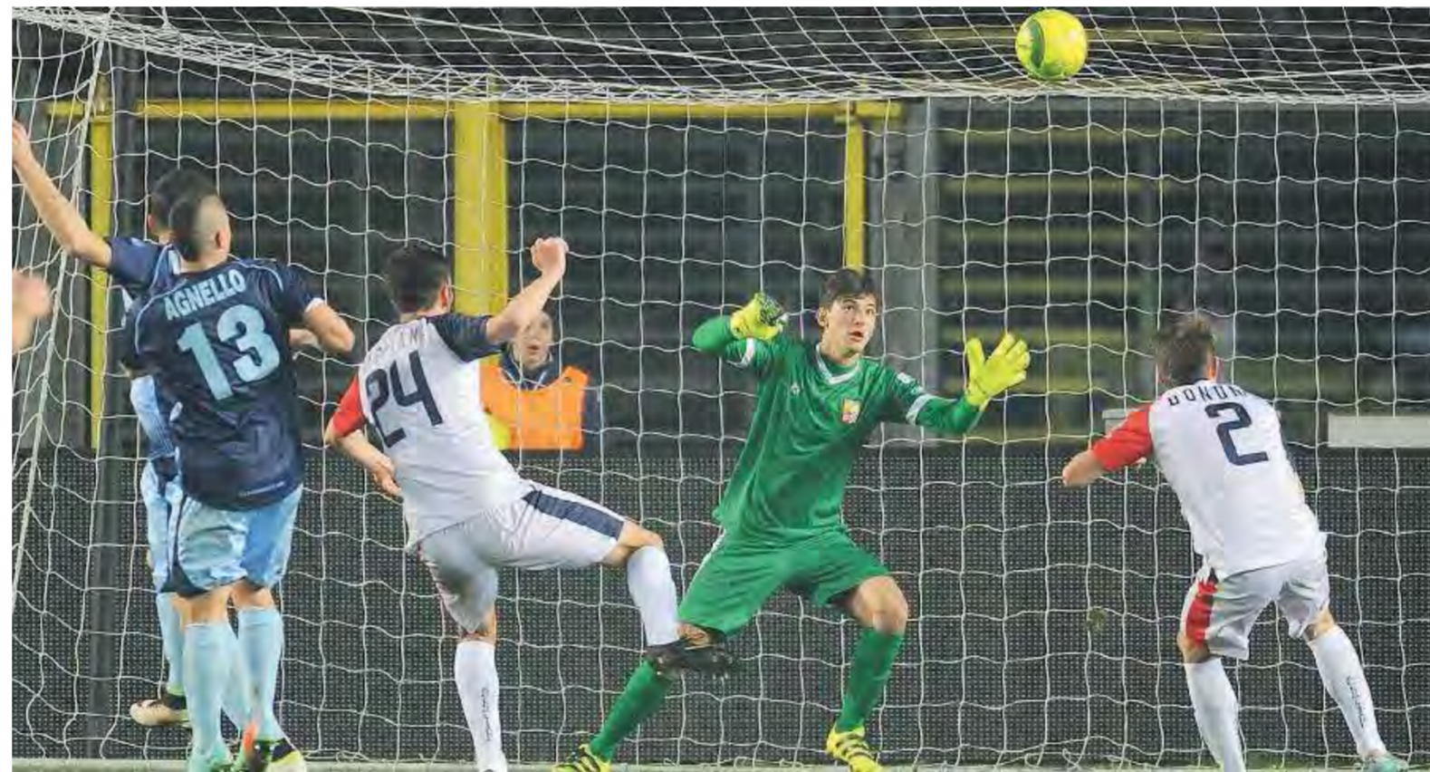
All'andata. Mastroianni firma l'1-0, l'AlbinoLefte batterà 2-0 il Lumezzane