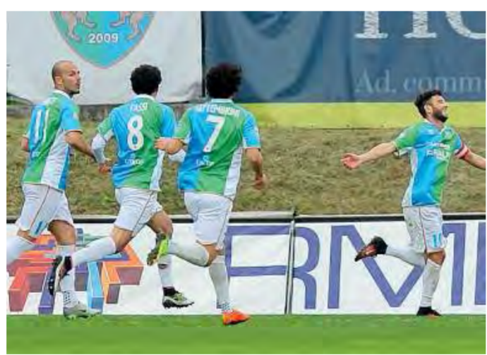
Salò. I verdebili vogliono replicare l'ampio successo sul Bassano

Confirme. «Questa gara è molto importante, a maggior ragione perché veniamo da un periodo nel quale ci stiamo comportando bene sotto l'aspetto delle prestazioni. Siamo riusciti a racimolare sei punti contro due squadre molto forti come Padova e Bassano. Ci presentiamo bene quindi all'appuntamento di Ancona con l'obiettivo