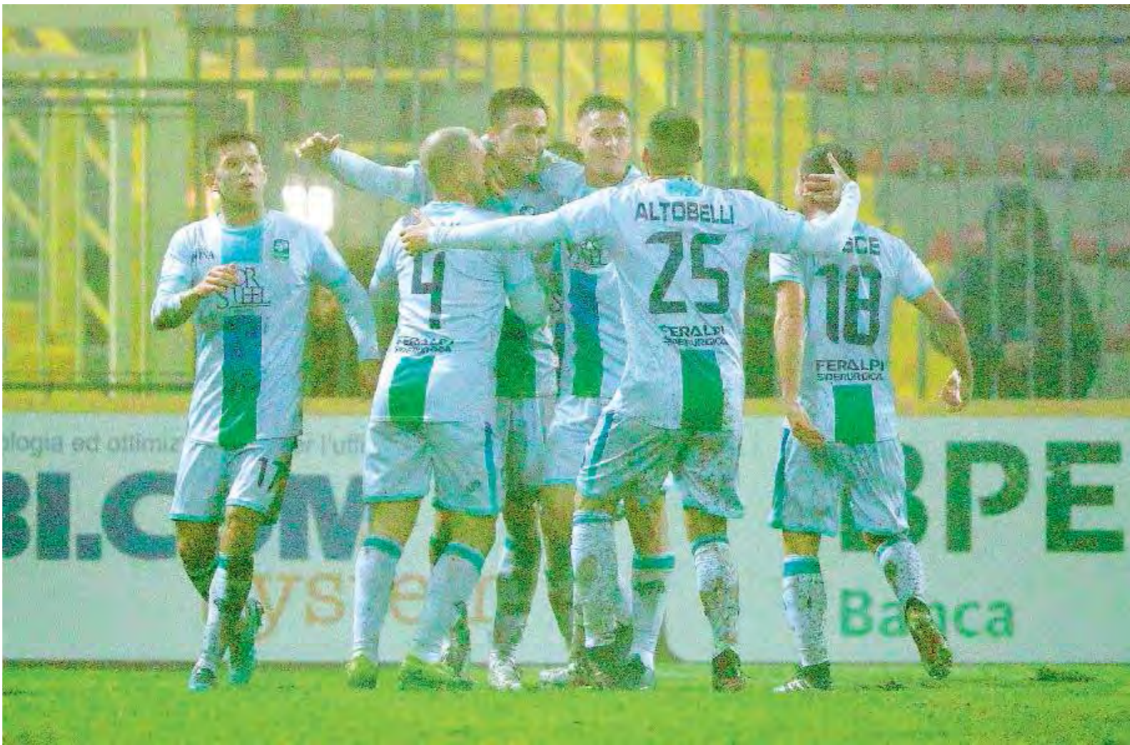
Nella nebbia. L'abbraccio della FeralpiSalò a Caracciolo

Due gol, due pezzi d'autore. Ancora decisivo. Dal 41' st gli subentra Francesco Stanco (sv). // F. D.