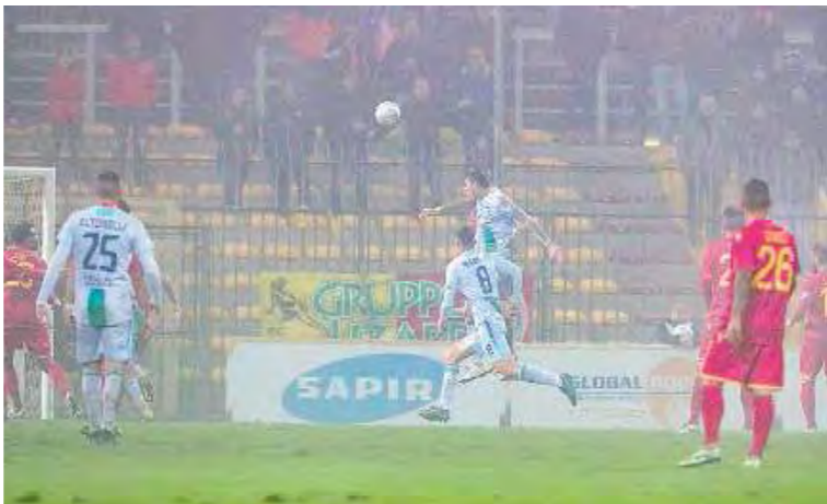
Airone/2. Il secondo gol della FeralpiSalò e doppietta personale di Caracciolo