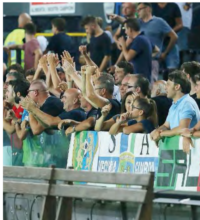
Esultanti. Una ventina i tifosi della FeralpiSalò presenti a Udine