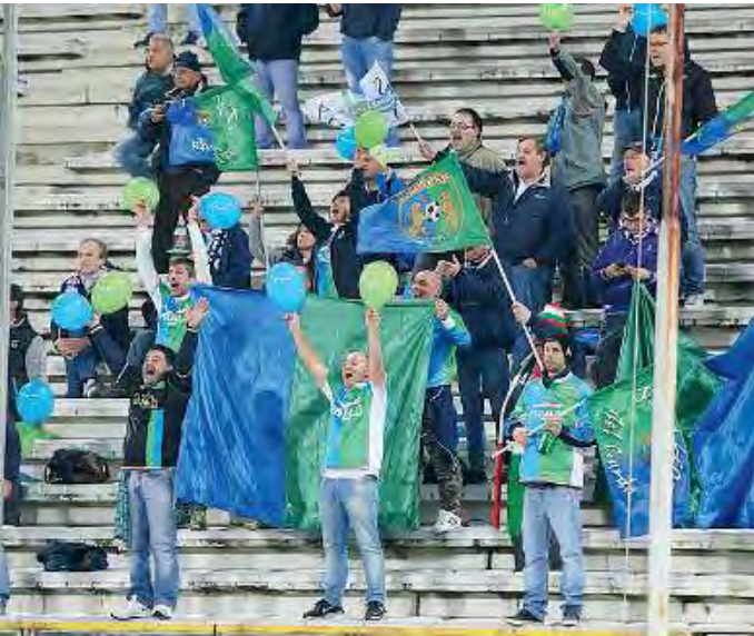
Pochi ma buoni. I tifosi della FeralpiSalò al Tardini