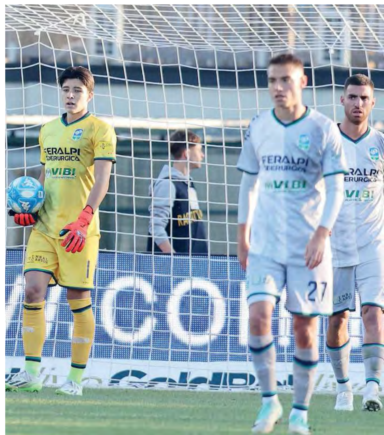
Disappunto. Otra sconfitta per la FeralpiSalò

La gara. La prova offerta al Liberati dalla compagine salodiana non è certo da buttar via, anzi.