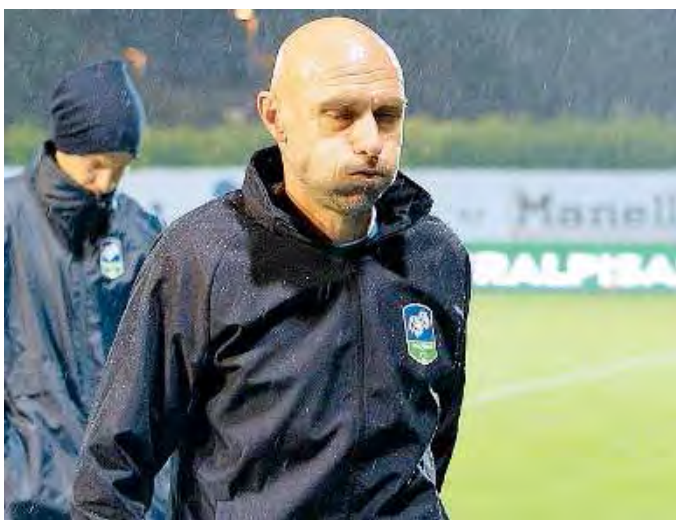
Gatta da pelare. Ce l'ha Sottili: deve sfatare i precedenti dicembrini