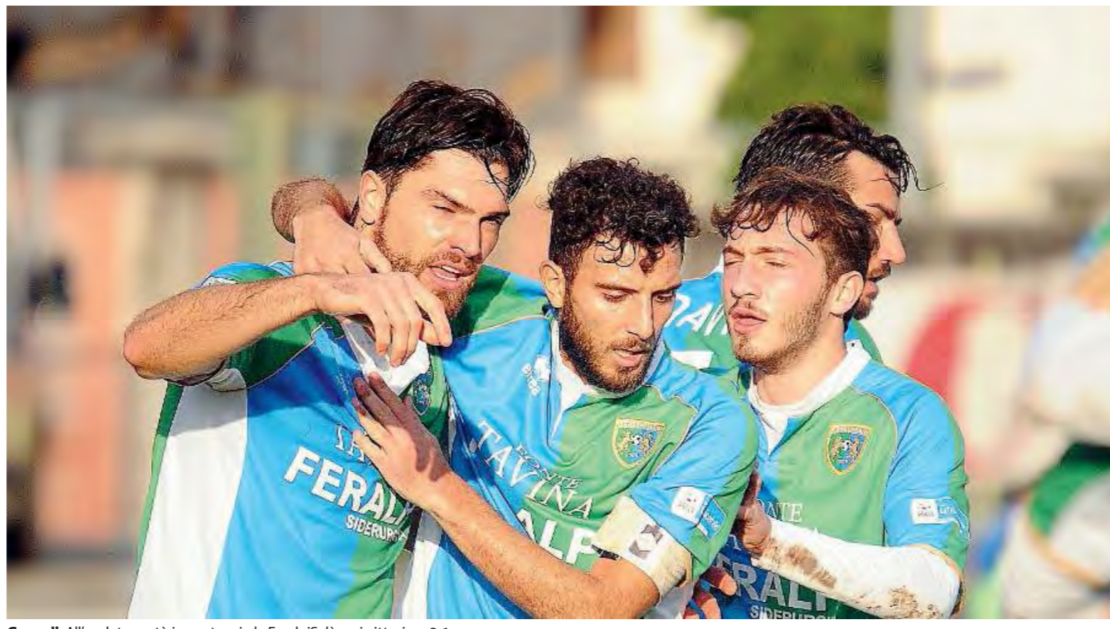
Gerardi. All'andata portò in vantaggio la FeralpiSalò, poi vittoriosa 2-1

I bookmakers danno però favorite le due squadre di casa nostra. Speriamo che abbiano ragione e che la sera sia dolce sul Garda ed in Valgobbia. //