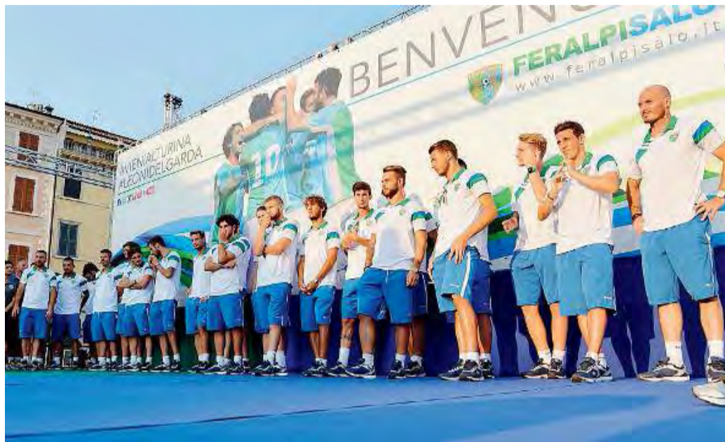
Pronti per la nuova avventura. I giocatori della FeralpiSalò durante la presentazione

Davanti il dubbio è tra Greco e Romero. Contro il Fano il primo è partito titolare e ha giocato bene, il secondo è entrato nel finale e ha segnato. //