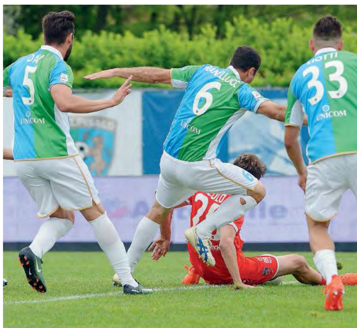
Mischia maledetta. E il Teramo passa