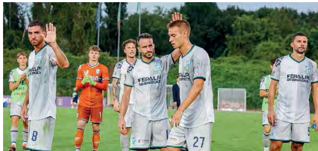
Su la testa. La FeralpiSalò nelle prime due uscite ha creato, ma non concretizzato