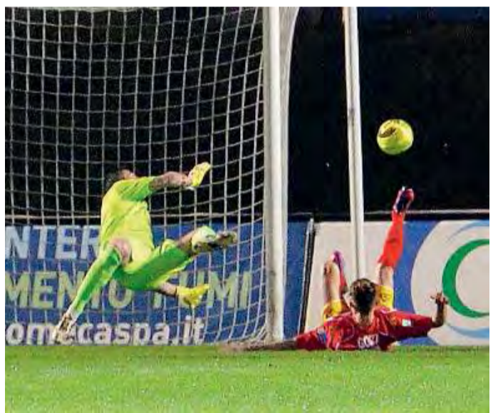
Caglioni. Un pregevole intervento su Goni del numero uno della Feralpi