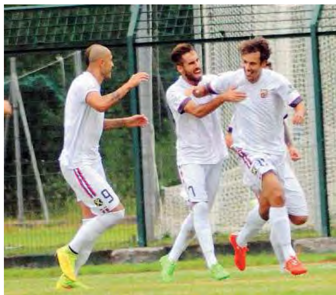
Festa. Il Lumezzane vuol gioire ancora come in agosto in Coppa Italia