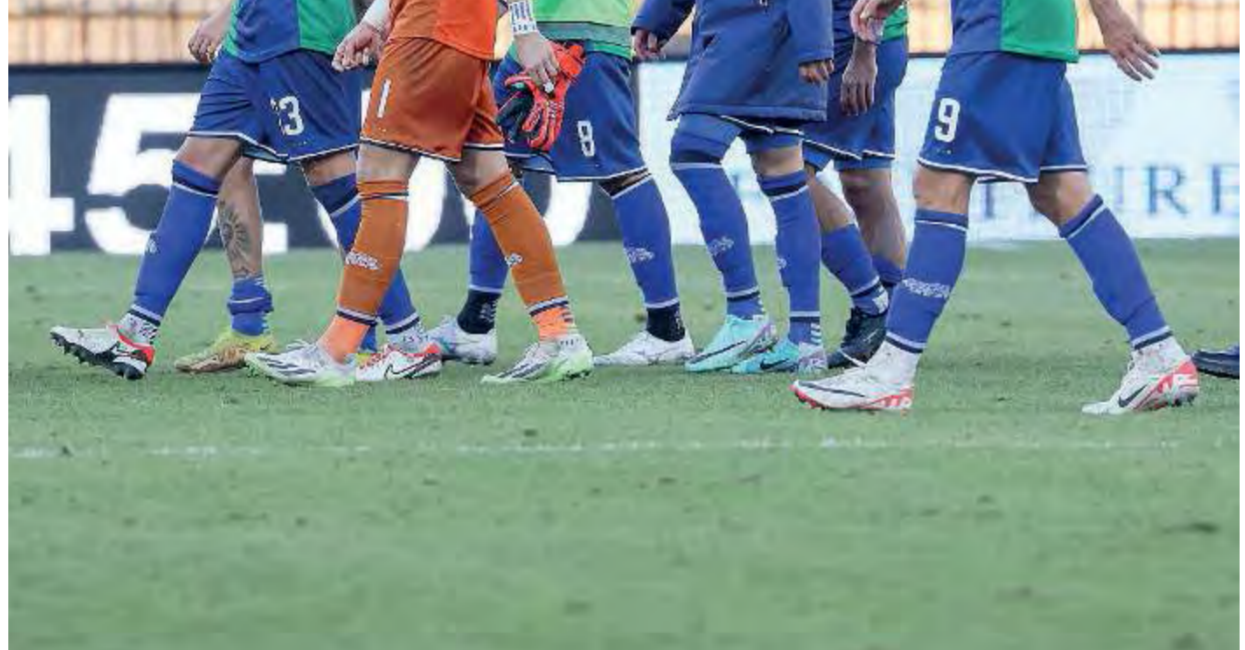
A capo chino. I verdeblù al termine del match

La gara. Parte bene la FeralpiSalò, anche se subito Fiordilino è costretto al fallo da ammonizione per fermare un contropiede di Pandolfi, ed è un cartellino pesante, perché costringerà il regista salodiano a saltare la gara di Terni ed obbligherà Zaffaroni a cambiare ancora l'undici iniziale. Cosa fatta anche ieri, ma con esiti rivedi-