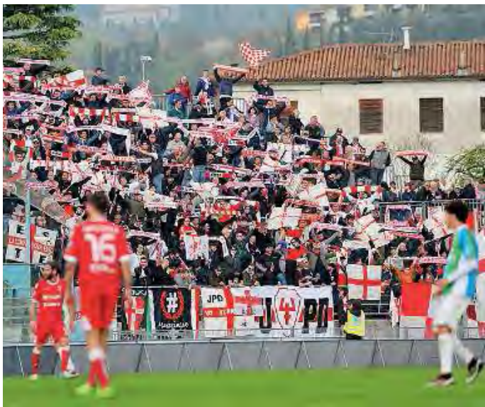
Muro padovano. Moltissimi i supporter veneti al Turina