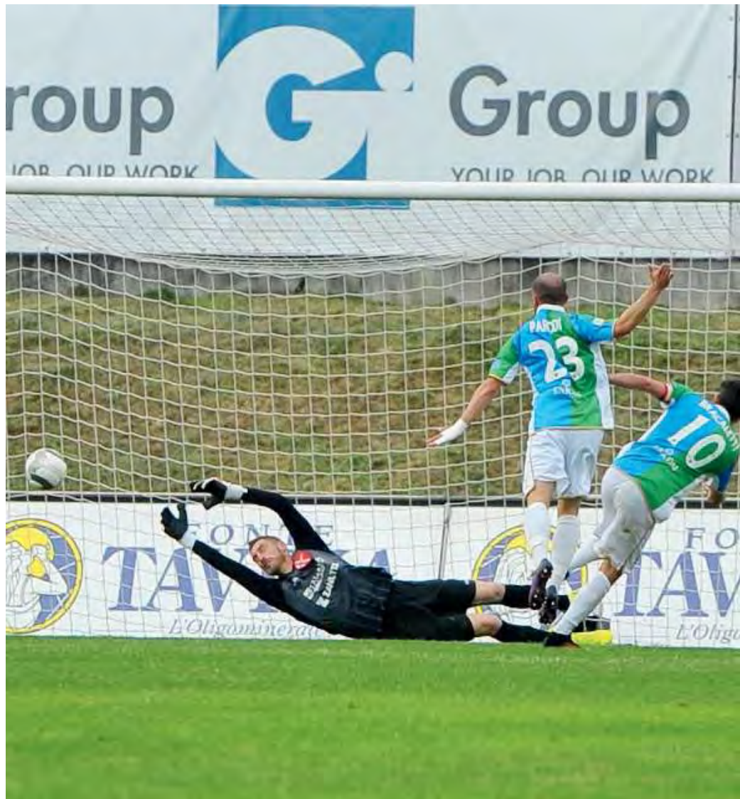
Il bis. La girata a rete del capitano verdeblù, che fa 2-0