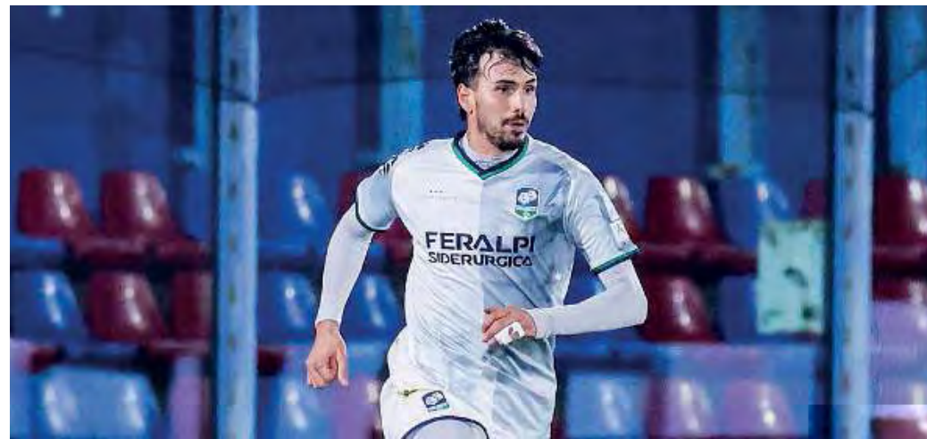
Titolare. Lo sarà oggi Pilati nel delicato match che attende la FeralpiSalò

Capitolo mercato: è appena arrivato l'attaccante Crespi, in prestito dalla Lazio, mentre Pellegrini è destinato a cambiare maglia (Gubbio o Vis Pes-