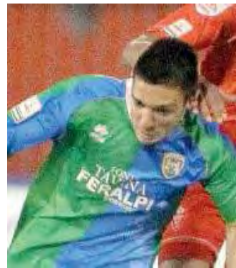
Ex. Palma nel 2015 in maglia Feralpi

Ternana, Catania, Catanzaro, Potenza, Bisceglie, Bari, Monopoli, Viterbese e Paganese p.ti 3; Virtus Francavilla, Reggina, Cavese e Picerno 1; Rieti, Avellino, Catanzaro, Teramo, Vibonese, Casertana, Rende e Sicula Leonzio 0.