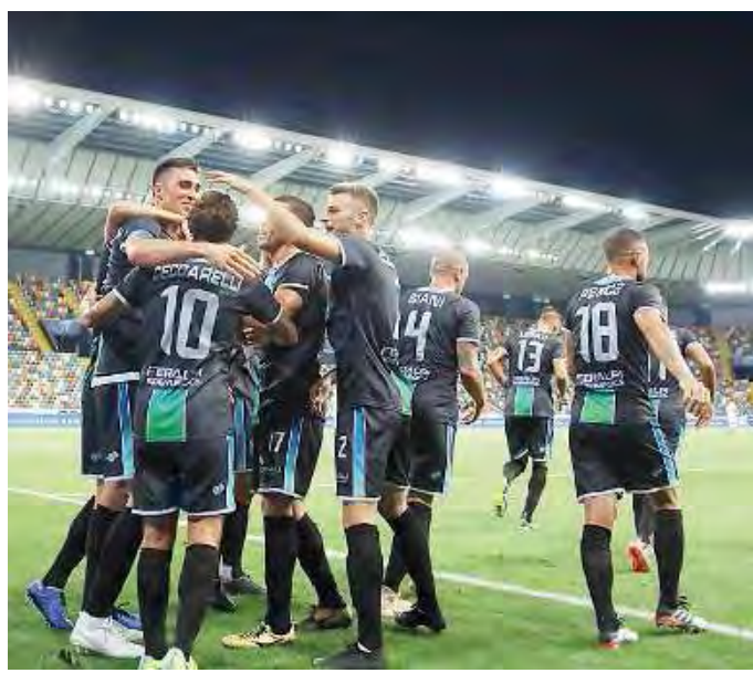
Festa. La FeralpiSalò vuole tornare a far bene come in precampionato