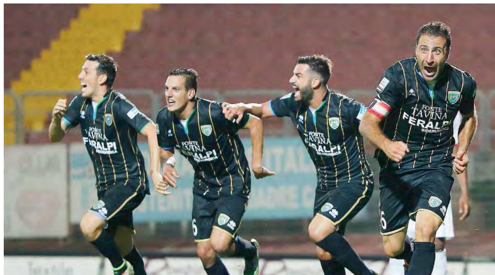
Esultanza. La FeralpiSalò deve ripartire dai tre punti di Mantova

Un risultato, il pari, che oggi sarebbe buono per il Lumezzane, non per la FeralpiSalò. //