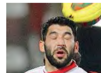
Bardelloni. Un bresciano a Forlì

Allenatore: Asta Panchina: 12 Livieri, 3 Ruffini, 15 Turano, 19 Codromaz, 16 Boldini, 14 Gamarra, 5 Davi, 18 Luche, 20 Gerardi Allenatore: Gadda Panchina: 22 Baldassarri, 23 Vesi, 11 Ponsat, 6 Ferretti, 8 Piccoli, 26 Capellini, 18 Di Rocco, 19 Croci, 25 Alimi