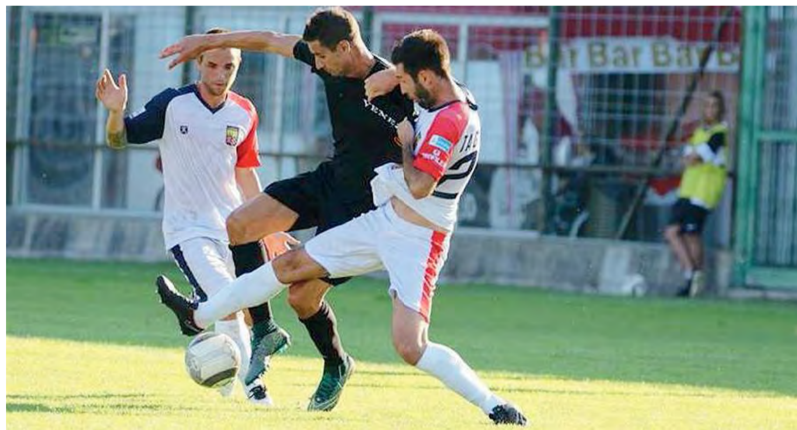
Attenzione. Il Lumezzane anche oggi sarà costretto a lungo sulla difensiva