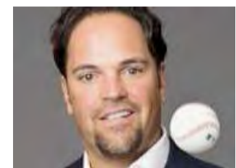
Usa, Piazza, presidente reggiano