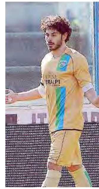
Settembrini. Salodiano ex Pontedera

Data. La sfida tra le formazioni di Antonio Asta e Paolo Indiani si disputerà in Toscana in novembre. Quasi certamente di mercoledì, il 2 oppure il 9, in base alle esigenze televisive, ma non è ancora certo. La gara verrà comunque calendarizzata solo dopo il turno di qualificazione previsto per il 18 e il 19 ottobre.