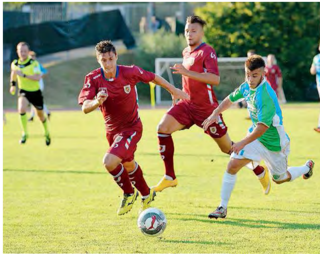
Luche. Ancora una buona prova per il giovane gardesano

di terzino sinistro, non si distingue per grandi interventi e nemmeno per imperiose cavalcate sulla fascia Dal 42' st Turano (6) , che fa il proprio dovere senza cercare di strafare.