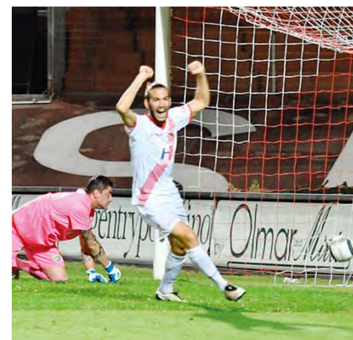
Il pallone in gol per il vantaggio dell'Acm

piange addosso, altrimenti è il caso che si faccia da parte. Anzi, siccome è evidente e lampante come sono stati commessi gli errori, voglio che questa delusione si tramuti in rabbia per rimettersi sotto a testa bassa e uscire da questa situazione. Tre volte che subiamo gol nel finale? È vero, un altro dato su cui riflettere a 360%. Di certo è una somma di piccoli difetti che poi vengono ingigantiti da ingenuità che ci costano partite e punti». (as)