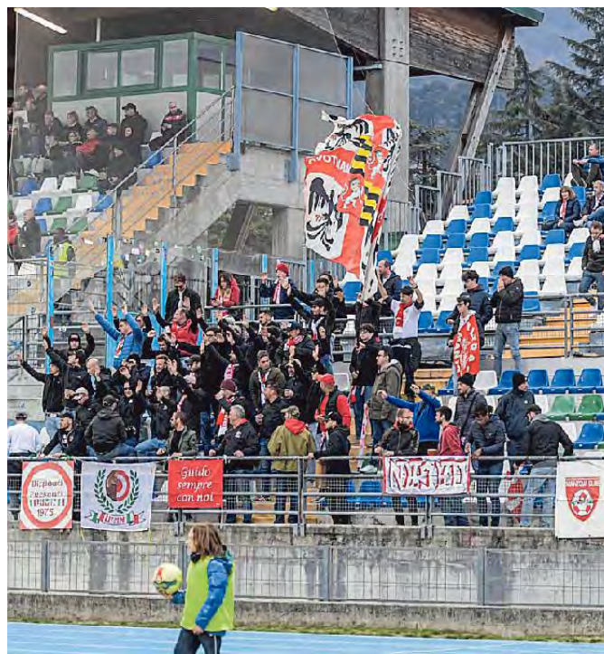
I tifosi biancorossi presenti allo stadio Turina di Salò