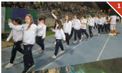
IL SETTORE FEMMINILE. La sfilata delle bambine che giocano nel vivaio della Feralpisalò: un progetto che sta dando frutti e in cui la società gardesana continua a credere fermamente. I risultati sono incoraggianti

crescita del settore giovanile, del femminile, del bellissimo progetto «Senza di me che gioco è» con i ragazzi che partecipano al campionato di Quarta categoria. Mercoledì sera il «Turina» ha fatto registrare il record di affluenza di tutti i tempi: 2.092 paganti, di poco superiore ai 2.008 della scorsa stagione contro il Catania, quarti di finale dei play-off. La Feralpisalò, ogni stagione, fa un passo in avanti. Ora tocca alla prima squadra. La semifinale è già storia, ma al presidente Pasini non può bastare.