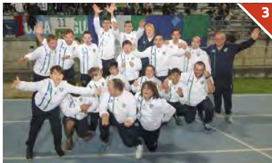
LA QUARTA CATEGORIA. Ragazzi davvero incredibilmente bravi quello del progetto «Senza di me che gioco è», battutisi come veri leoni (del Garda) nel loro campionato: ovazione da parte dello stadio «Turina»