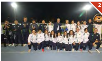
LE VINTRICI. La prima squadra femminile della Feralpisalò, che ha conquistato la promozione in Eccellenza vincendo i play-off: un traguardo davvero strameritato al termine di una stagione da incorniciare