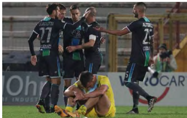
La Feralpisalò conferma un trend positivo in trasferta: tre le vittorie esterne stagionali dei verdeblù

Anche l'anno scorso la Feralpisalò aveva fatto meglio fuori (battute Albinoleffe, Sudirotol, Giana, Vicenza, Teramo, Rimini, Gubbio, Fano, Renate) che in casa (vittorie su Teramo, Rimini, Gubbio, Fano, Ternana, AlbinoLeffe, Ravenna, Vis Pesaro), riportando il conto in parità (9-9) nei play off, con l'1-0 sul Catanzaro. D'accordo essere corsari, ma non guasterebbe una navigazione più regolare sul lago. ●