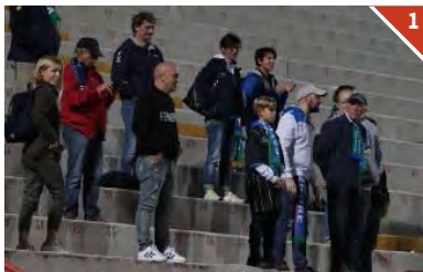
I TIFOSI. Ecco gli aficionados gardesani sugli spalti dello stadio «Menti» di Vicenza: la loro passione è stata ripagata con una bella vittoria