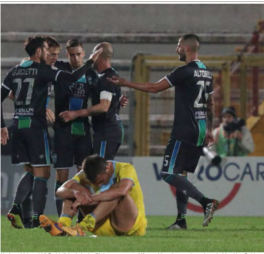
L'esultanza dei giocatori della Feralpisalò dopo la vittoria sull'Arzignano