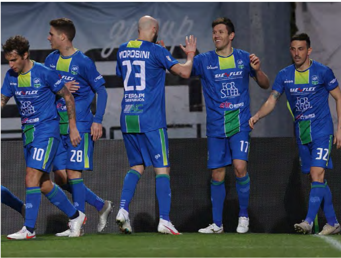
Successo preziosissimo per una Feralpisalò unica e di nuovo vincente