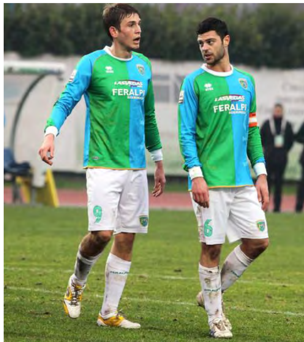
Miracoli e Magli: hanno firmato le ultime reti di una Feralpi Salò che non segna da due partite

Negativo il bilancio dei gardesani con l'arbitro Ripa: tre sconfitte (l'ultima, a metà settembre: 0-3 al Turina col Lumezzane), due pareggi e appena una vittoria. ●