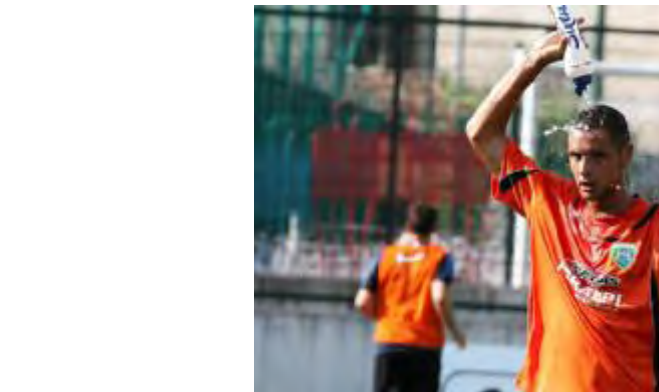
IL CALDO. Si è giocato con un caldo assillante sul campo di Rovereto: per le squadre, alle prese con le fatiche della preparazione, un impegno supplementare.