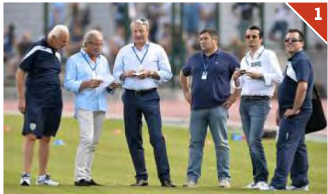
L'ATTESA. I dirigenti della Feralpi Salò in campo prima del fischio d'inizio: un test impegnativo e di prestigio per i gardesani contro l'Inter di Walter Mazzarri.

Il punteggio ci può stare, ma è l'atteggiamento della squadra che è piaciuto: la Feralpi Salò ha tenuto il campo contro l'Inter mostrando intraprendenza e personalità, e meritandosi un applauso.