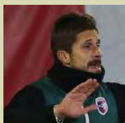
Alessio Dionisi (Imolese)

Oggi alle 17, Catanzaro e Feralpisałò saranno le prime a scendere in campo nei quarti di ritorno dei play-off. Tutte le altre giocheranno alle 20.30. Dopo il 2-2 dell'andata, il Pisa ospiterà la Carrarese di Silvio Baldini: basterà un pareggio per qualificarsi. Identica situazione per la Catania, dopo l'1-1 ottenuto in trasferta a Potenza. L'Imolese riceverà il Monza di Cristian Brocchi forte dei 3-1 dell'andata in Brianza: gli emiliani per uscire di scena dovranno perdere con tre gol di scarto.