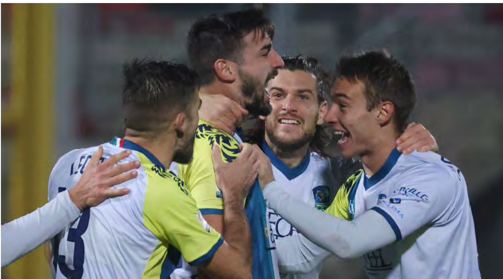
L'esultanza dei giocatori della Feralpisalò dopo la vittoria per 2-0 a Fiorenzuola il 21 dicembre: domani, dopo 33 giorni, sarà di nuovo campionato contro il Lecco allo stadio Turina