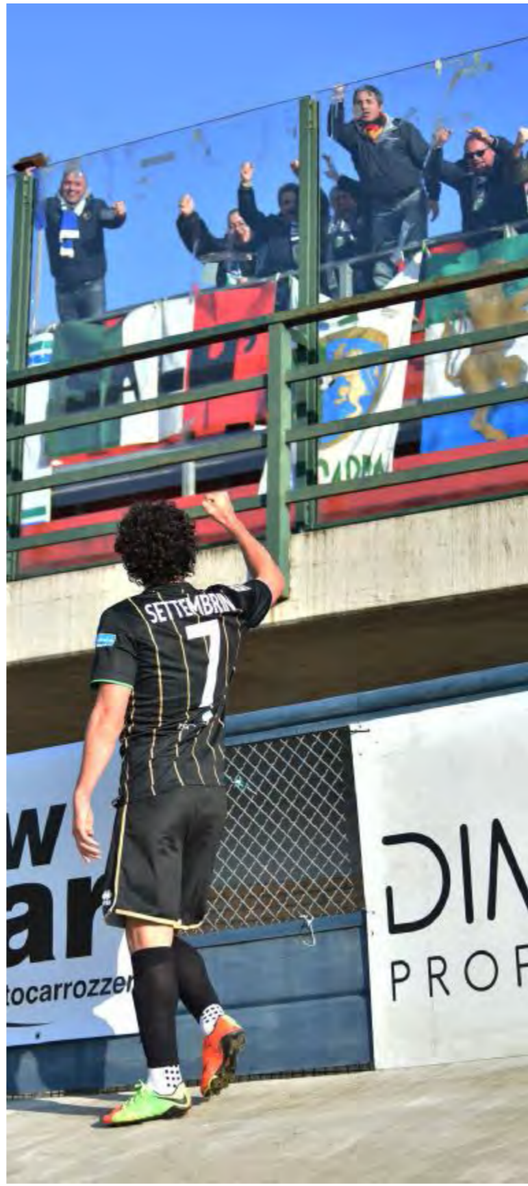
Settembrini festeggia con i tifosi della Vecchia Guardia allo stadio di Forlì

Domenica, alle 16.30, al «Turina» esame di maturità con la vicecapolista Parma, battuta all'andata. ●