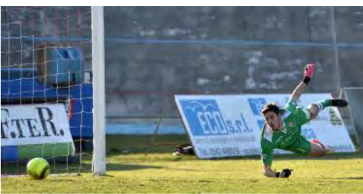
La conclusione di Luche, che al 32' della ripresa porta in vantaggio i gardesani