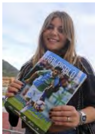
Feralpi News con Bresciaoggi

IL MAGAZINE , di 48 pagine, nasce come prodotto editoriale da collezione considerando i contenuti: