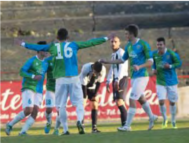
Esultano i giocatori della Feralpi Salò dopo l'autorete del pareggio

La Feralpi Salò schiaccia subito il piede sull'acceleratore. Nei primi 10 minuti costruisce