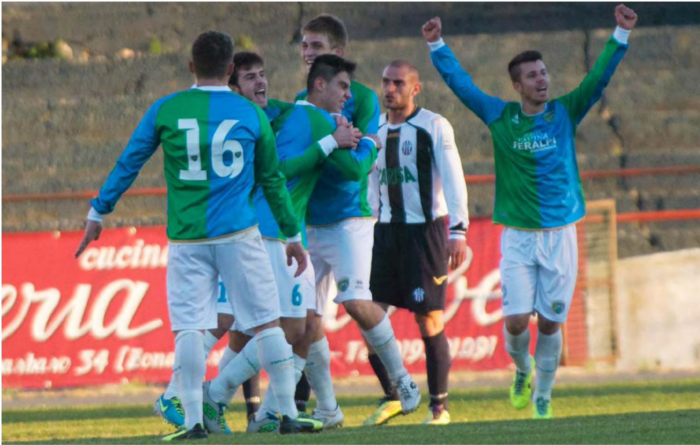
La gioia dei giocatori della Feralpi Salò dopo aver raggiunto l'1-1 a Savona.

Nonostante fosse per loro la trasferta più a caro prezzo della stagione. Per niente agevole.