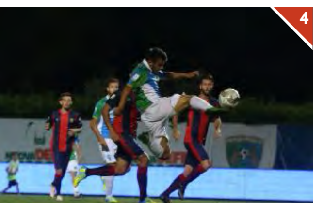
2-2. A mettere l'ultima parola sul derby è Lucche che con una spettacolare acrobazia non sbaglia sigillando il risultato sulla parità. È il 28' del secondo tempo. Inutile l'assalto finale della Feralpi Salò: il derby finisce pari.