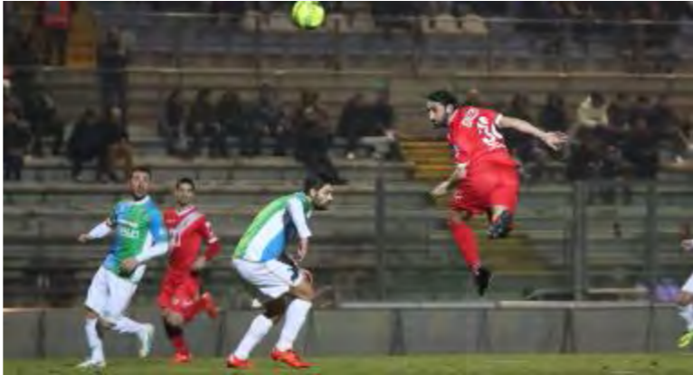
Le reti di Guazzo al 32' del primo tempo: Feralpi Salò condannata alla sconfitta