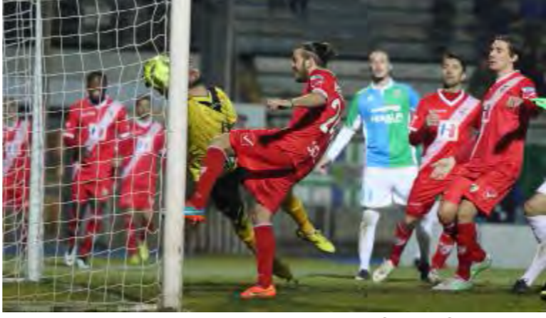
Regoli respinge la conclusione di Ferretti: c'è il sospetto forte che fosse gol