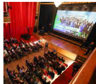
La cornice Desenzano e il Teatro Alberti, una platea gremita e il grande schermo

Una serata speciale per mettere in pausa per un attimo il campionato e celebrare la storia recente di una società che raggiunto un traguardo straordinario. La Feralpialò si è stretta attorno alla sua gente. Il Teatro Alberti a fare da cornice all'evento e alla prima di «OttoQuattroVenticinque».