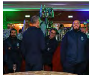
Gli ospiti Dirigenti, sponsor, collaboratori e tifosi. Mancavano soltanto i giocatori