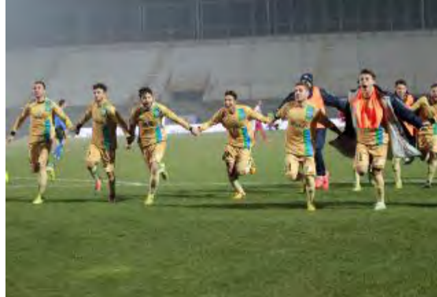
Lesultanza finale dei giocatori della Feralpi Salò: successo d'oro

«ha già vinto il premio come gol più bello dell'anno») e di Scienza («un tecnico bravissimo, sta facendo un ottimo lavoro»).