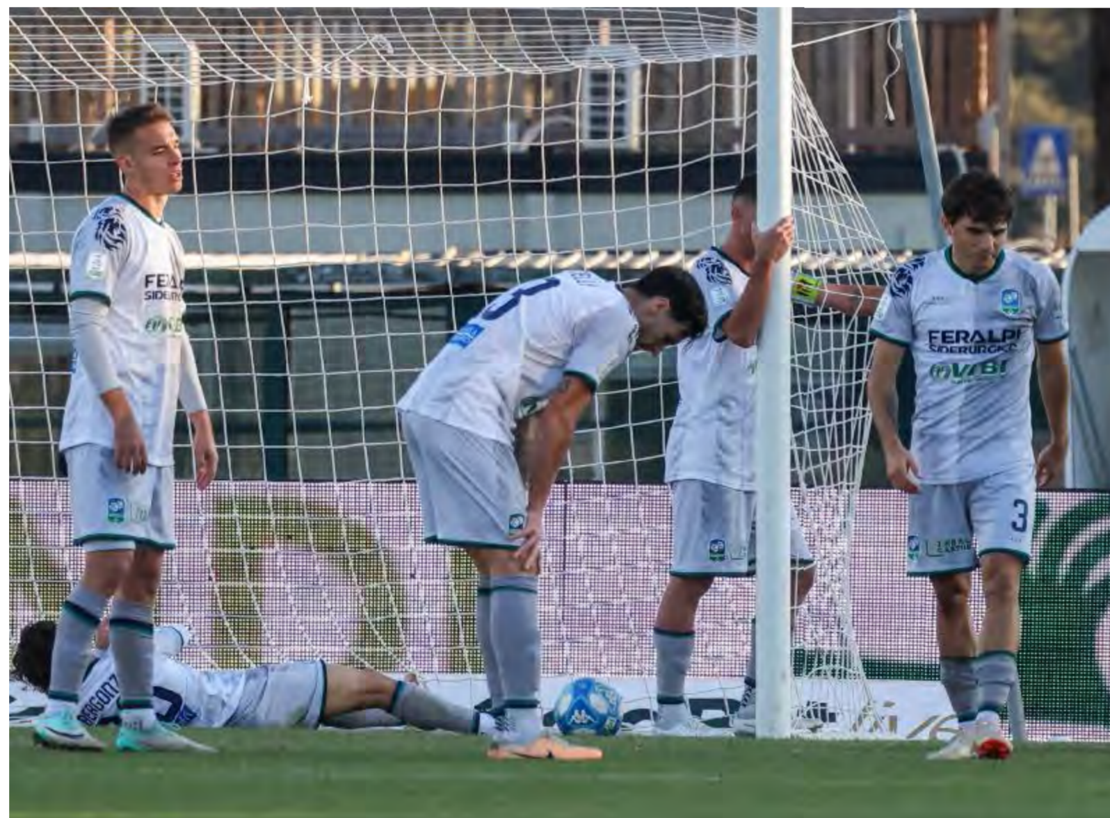
Vicolo cieco La disperazione dei giocatori della Feralpialò: a Terni sconfitta numero 11 in 16 partite

Uno a uno, dunque, e match riaperto. La Feralpialò è cresciuta, sul piano del coraggio