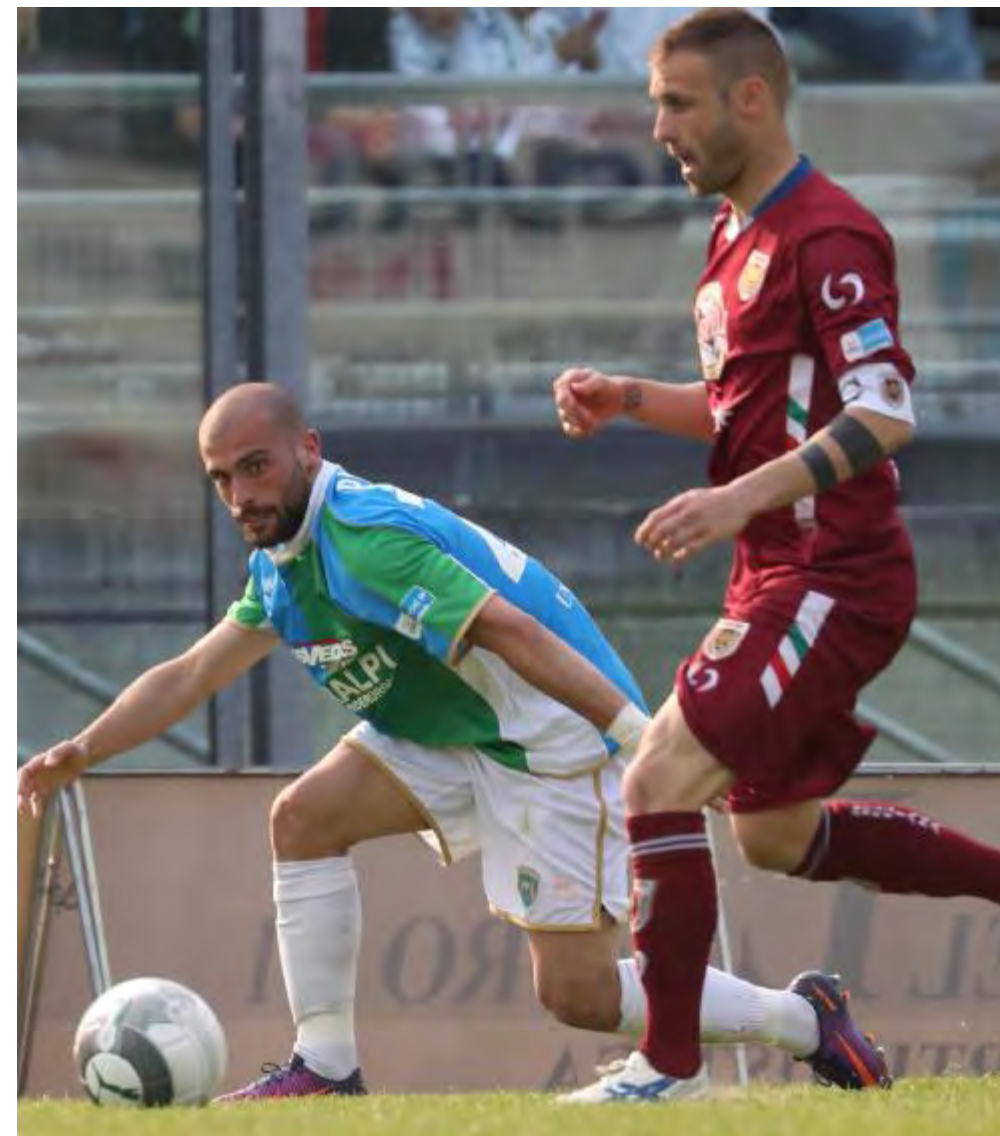
Per la Feralpi Salò è in arrivo la terza sfida stagionale contro la Reggiana: ai play-off servirà solo vincere

bre, 5-0 col Forlì nella notturna del 1 ottobre, 2-1 lunedì 10 a Parma, 2-2 sabato 15 a Bergamo con l'AlbinoLeffe, 0-0 col Fano il 22. In aprile-maggio la sequenza è stata di quattro: 3-0 col Bassano, 1-1 ad Ancona, 4-4 con la Reggiana (rimonta da 1-4 negli ultimi 12 minuti), 2-1 a Pordenone. Bilancio complessivo: 15 vittorie, altrettante sconfitte,